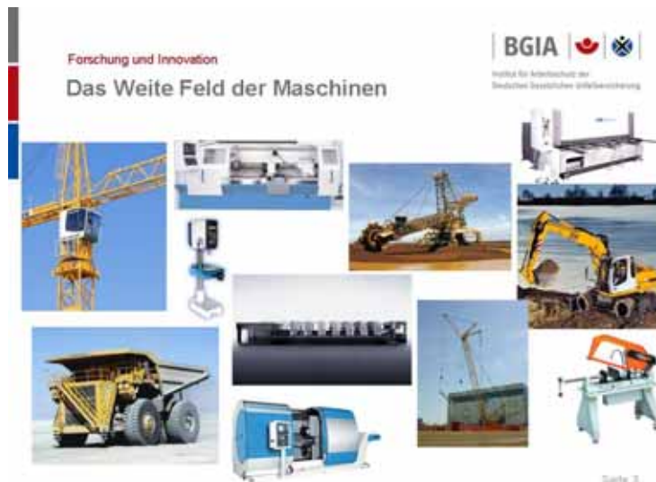
Abbildung 1: Typische Maschinen