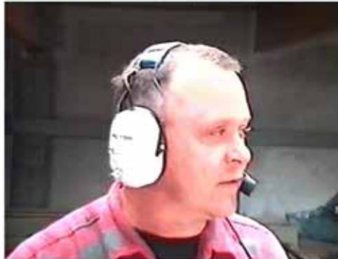
Abbildung 5: Sprachsteuerungen an Maschinen