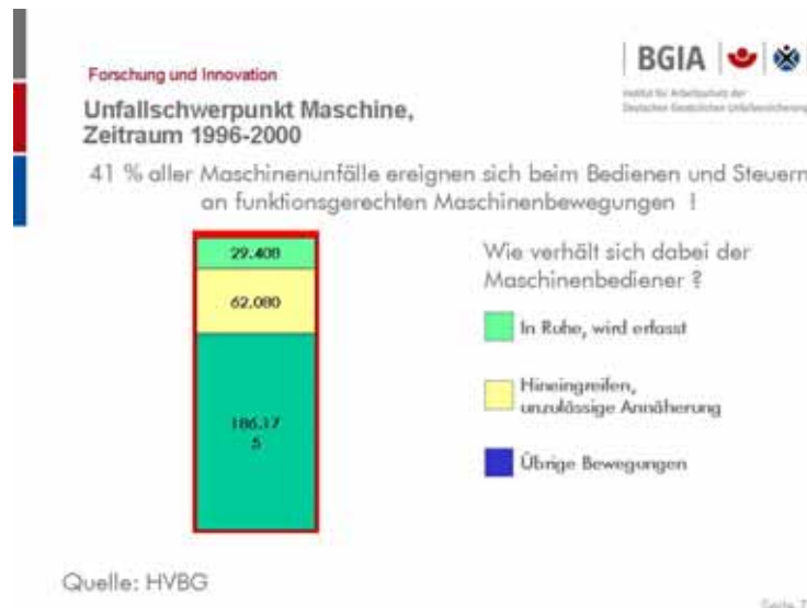
Abbildung 3: Verhalten des Maschinenbedieners

Eine genauere Auswertung dieser Zahlen lässt mehrere Thesen zu, die leider derzeit nicht beweisbar sind, aber durchaus Ansätze für Prävention liefern können: